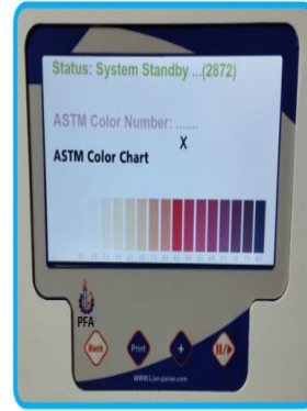
ASTM Color Chart