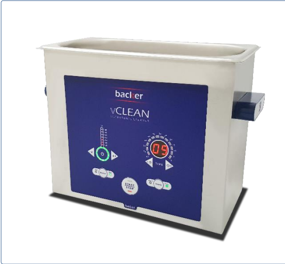
دستگاه حمام التراسونيك