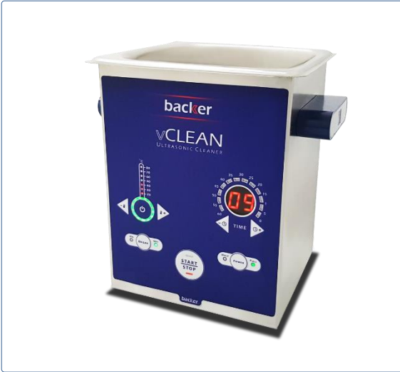
دستگاه حمام التراسونيك