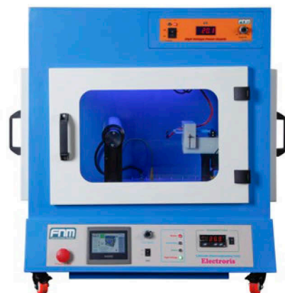
دستگاه الکتروریس تک پمپ

نوع: PLC HMI: صفحه لمسی ۴/۳ اینچ کنترل: • موقعیت ابتدا و انتهای نازل(ها) • نرخ تزریق پمپ(های) سرنگی • فاصله(های) الکتروریسی • زمان الکتروریسی • تایمر روشن / خاموش فن تهویه • کنترل سرعت چرخش در مدل‌های استاندارد توسط ولوم و در مدل‌های دو پمپ از طریق HMI • کنترل دما • اعلام هشدار پس از رسیدن به حجم تزریق مورد نظر و پس از اتمام محلول داخل سرنگ (پس از اینکه سویچ پمپ سرنگی عمل می‌کند). • نمایش رطوبت محفظه (مدل دو پمپ)