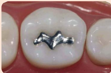
آموزش انواع مختلف آمالگام و کامپوزیت