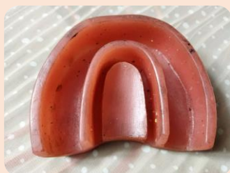
قابلیت مانع کردن دندان بر روی کست