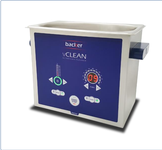
دستگاه حمام التراسونیک