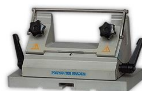
مخصوص هلدرتیغ های یکبار مصرف و تیغ های دائمی