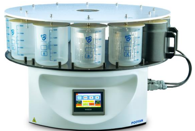
پردازشگر بافت پویان