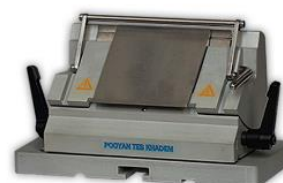
نگهدارنده اهرمی تیغ