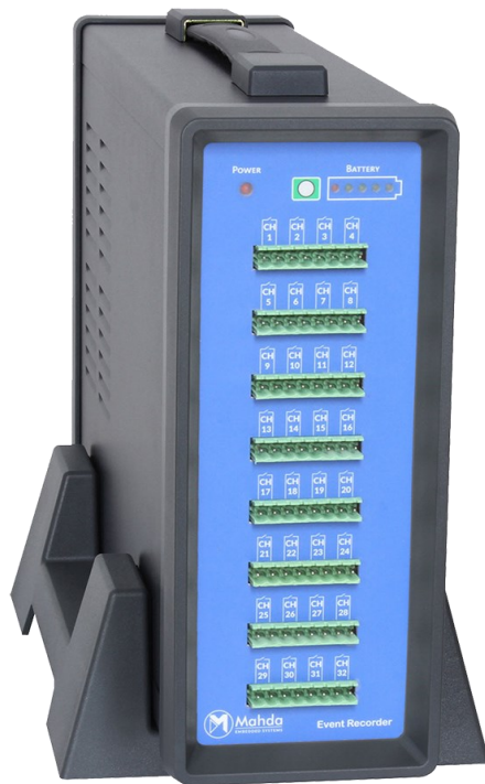
تصویر مربوط به دستگاه ۳۲ کانال است

ثبت کننده رویداد MA-ER1 ابزاری قدرتمند جهت تشخیص و اندازه گیری فواصل زمانی بین پالس های دیجیتال ورودی، با دقت بالا است. این سامانه در انواع ۸، ۱۶، ۳۲ و ۶۴ کانال به منظور محاسبه زمان بین سیگنال های دیجیتال با ولتاژ ۵ الی ۲۴ ولت طراحی و ساخته شده است. داده های نمونه برداری شده توسط این دستگاه با سرعت نمونه برداری بالا (۱، ۱۰ یا ۱۰۰ میلیون نمونه در ثانیه)، از تمامی کانال های ورودی دریافت شده و در لحظه مورد تحلیل قرار می گیرند تا فواصل زمانی مرتبط با تحریک های انجام شده بدست آیند. این امکان فراهم شده است تا بتوان از طریق واسط Ethernet داده های دریافت شده را روی نرم افزار mERS مشاهده و ثبت کرد. این نرم افزار، امکانات بسیار زیادی از جمله امکان مشاهده تمامی کانال های ورودی و تمامی زمان های محاسبه شده را در اختیار کاربر قرار می دهد. همچنین این امکان فراهم شده است تا بتوان هر یک از پارامترهای دلخواه را در محدوده زمانی دلخواه ذخیره نمود.