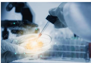
دستگاهی قدرتمند و قابل اعتماد برای حل چالش های علمی

میکرو اسپکترو فوتومتر ترکیبی از روش های مختلف طیف سنجی و تصویربرداری با بیشترین انطباق است. این دستگاه به آسانی می تواند برای بررسی نمونه های میکروسکوپی استفاده شود. میکرو اسپکترو فوتومتر برای هر محقق و آزمایشگاهی ایده آل است چرا که با آن می توان به سادگی میان روش های مختلف طیف سنجی و میکروسکوپی سوئیچ کرد و از صحت و تکرار پذیری داده ها اطمینان داشت.