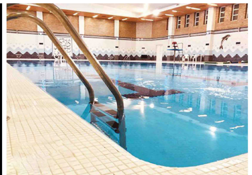
نمونه کار استخر فجر دانشگاه شهید بهشتی