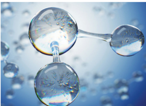
افزایش کیفیت آب استخر با ازن