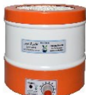
Model H500 500mL Capacity