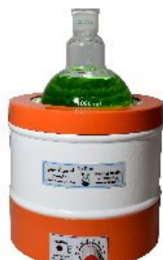
Model H1000 1 Liter Capacity