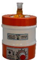
Model H10 10mL Capacity

شرکت آماتیس آرا شیمی (دانش بنیان) تولید کننده انواع شوف بالن