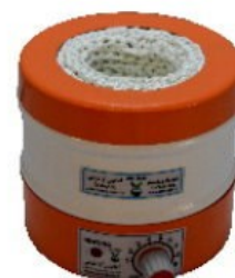
Model H250 250mL Capacity