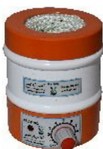
Model H25 25mL Capacity