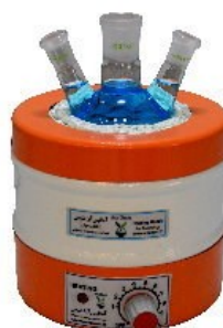
Model H100 100mL Capacity