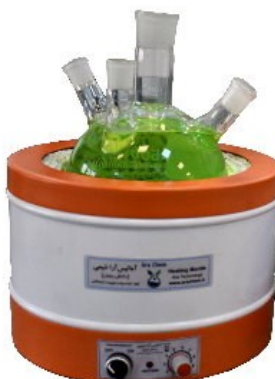
Model H5000 5 Liter Capacity