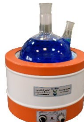
Model H6000 6 Liter Capacity

مشخصات فنی هیتر متل یا شوف بالن : بازه دمای قابل تغییر: تا ۳۵۰ درجه سانتی گراد ولتاژ کاری دستگاه: ۲۲۰ ولت ۵۰ هرتز جنس بدنه: آلیاژ آلومینیوم فرآوری شده نوع رنگ بدنه: پوشش الکتروستاتیکی ضد اسید