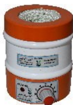
Model H50 50mL Capacity