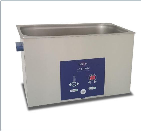
دستگاه حمام التراسونیک